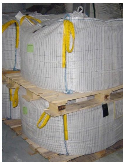
Altpulver-Bestände werden in BigBags zur Aufbereitung und Verwertung angeliefert

Die Kommission der EU hat zu Auslegungsfragen betreffend Abfall und Nebenprodukte eine Mitteilung herausgegeben (EC 21.02.2007). Diese behandelt detailliert das Thema, ob ein Stoff ein Abfallstoff ist oder nicht.