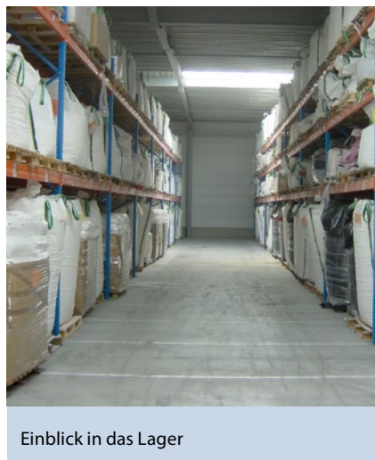
Einblick in das Lager

Wenn die Behörde einverstanden ist, dass es sich beim Altpulver um Ne-